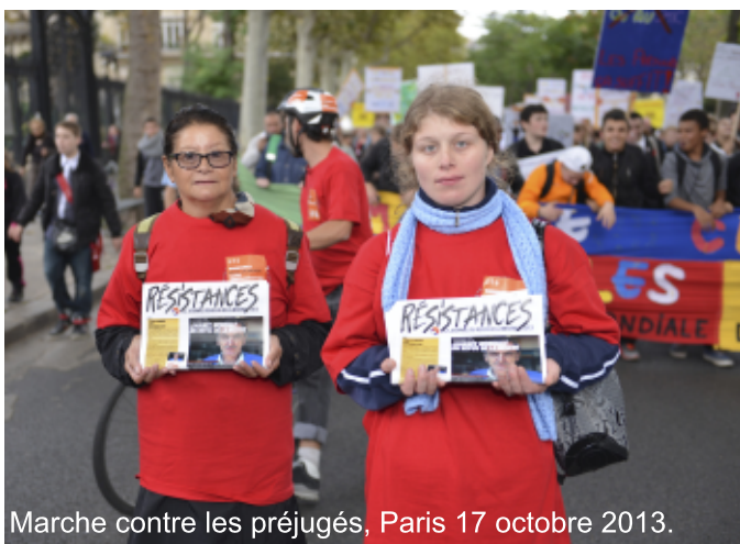
Marche contre les préjugés, Paris 17 octobre 2013.

D'autres événements en France et dans le monde sur www.refuserlamisere.org